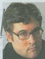
JUAN MANUEL DE PRADA

C UENTAN que, mientras pronunciaba una conferencia de asunto literario en Chile, Agustín de Foxá dijo: «En España, entonces, la gente moría por honor». A lo que un exaltado que se hallaba entre el público se irguió de su asiento y berreó: «Pues en Chile se muere por la democracia». Foxá, sin inmutarse, dirigió una mirada desdeñosa al exaltado y replicó, antes de proseguir con la conferencia: «Ya, pero eso es como morir por el sistema métrico decimal». En la España de hoy, a diferencia de la España que evocaba Foxá, nadie muere por honor, y tampoco por la democracia; en cambio hay mucha gente sin honor que por la democracia estaría dispuesta a matar si le dejasen. Bueno, en realidad a esta gente no la mueve la democracia, sino el odio; pero ha rebozado ese odio con tanto disimulo que logra hacerlo pasar ante los ojos de los incautos como adhesión a la democracia, como el cocinero socarrón logra que las sobras del día anterior pasen por deliciosas croquetas, rebozándolas en huevo y pan rallado.