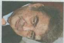
M. MARTÍN FERRAND

EN 1948, Agustín de Foxá obtuvo el premio Mariano de Cavia por un artículo publicado en ABC con el mismo título que encabeza estas líneas. En feliz y divertida compañía con los cráneos incas del Museo de la Plata, deformados y puntagudos en busca de no se sabe qué mérito o que creencia, el escritor se inquietaba ante quienes, entonces como ahora, intentan moldear el pensamiento ajeno y ponerlo a su servicio. «Nuestros crá-