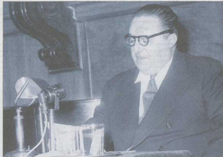
Agustín de Foxá, en el Ateneo de Madrid, en 1957.

por el fundamental ensayo La resistencia silenciosa . Fascismo y cultura en España , habla de «medetura de pata irreflexiva». «Por otro lado, si ha sido reflexiva, es peor: no hace el menor daño a Foxá sino que lo victimiza ridículamente. Había sido fascista, aristócrata, cínico y jovial, además de